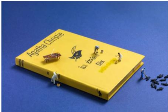
Dix petits nègres, le poids des mots en 2020

Le patrimoine culturel en temps de crise : Le Liban après la double-explosion du 4 août 2020 à Beyrouth